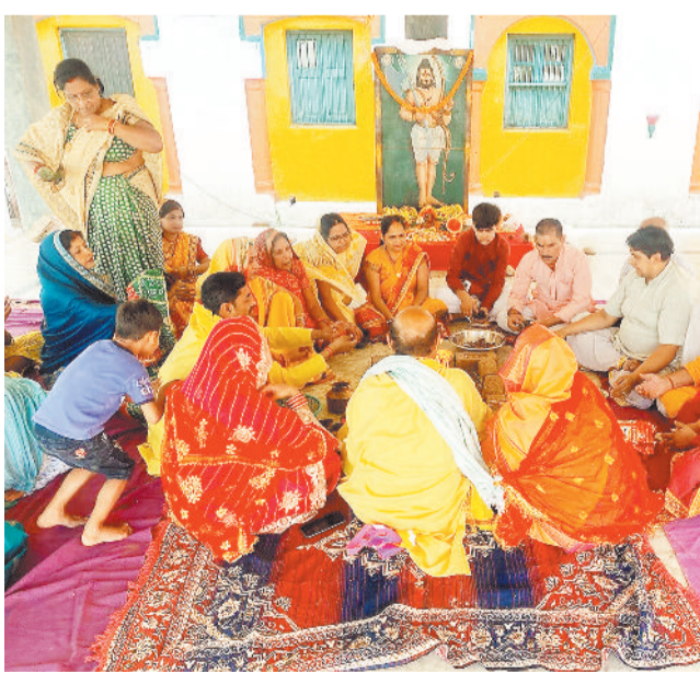
भगवान परशुराम जन्मोत्सव पर पूजा-अर्चना करते ब्राह्मण समाज के लोग।

जिला मुख्यालय में सर्व ब्राह्मण समाज के तत्वावधान में भगवान परशुराम जन्मोत्सव हर्षोल्लास और श्रद्धा के साथ मनाया गया। इस विशेष अवसर पर बालाजी मंदिर में भगवान परशुराम की पूजा-अर्चना का आयोजन की गई। सुबह से ही समाज के लोग पारंपरिक वेशभूषा में मंदिर प्रांगण में एकत्र हुए। वैदिक मंत्रोच्चार के साथ पूजा प्रारंभ हुई, जिसमें पंडितों द्वारा भगवान परशुराम की विशेष आरती एवं अभिषेक किया गया। समाज के वरिष्ठजनों, महिलाओं, युवाओं और बच्चों ने उत्साहपूर्वक भाग लिया।