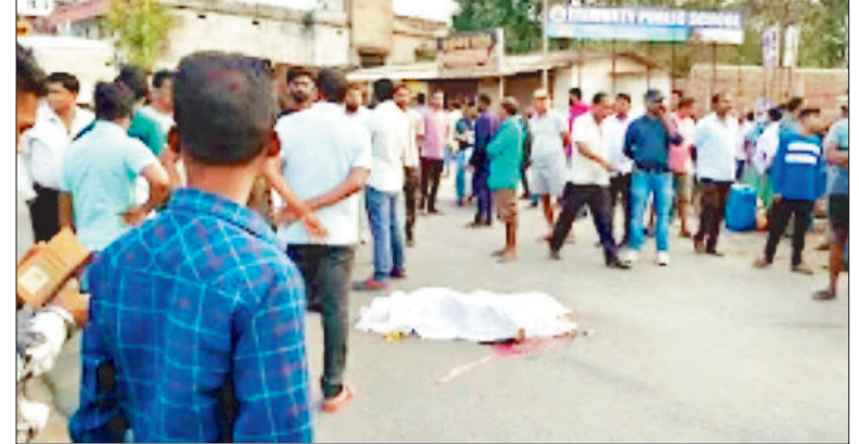
दुर्घटना के बाद चक्काजाम करते नागरिक।